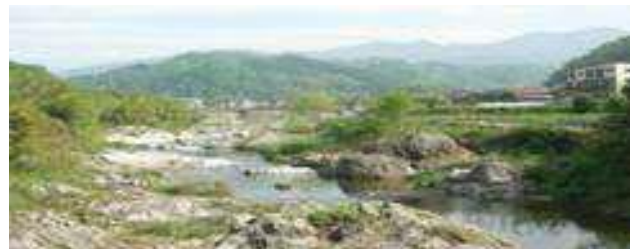
観月橋から見た岳八幡

ああ！私の友は素晴らしい人ばかりです。最後になりましたが幹事さん本当に有難うございました。心からお礼申し上げます。(高松市香南町在住)